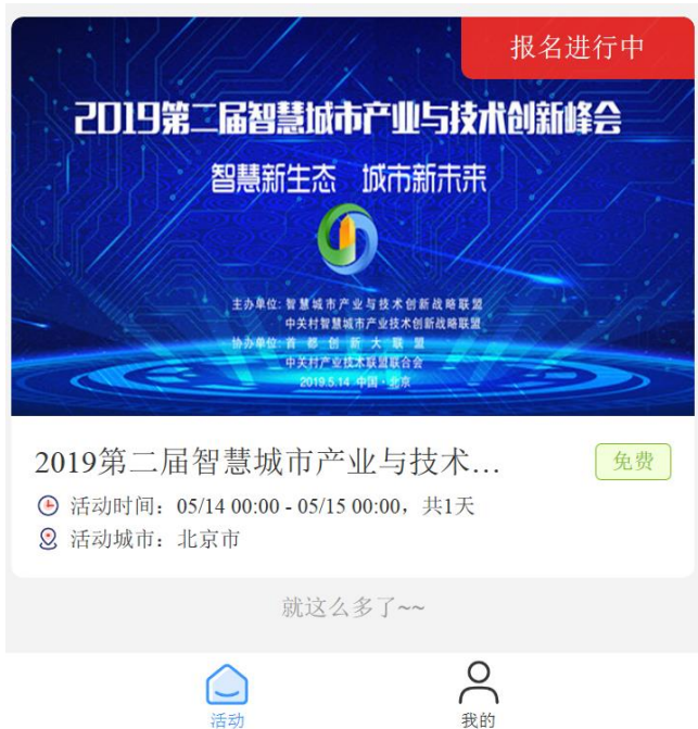
用户短信登陆, 参与活动