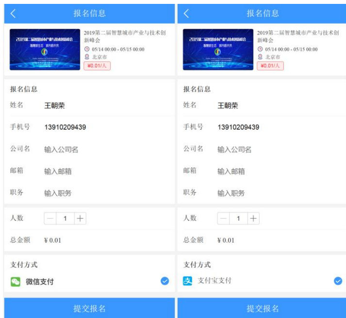
收费会议（微信、支付宝）